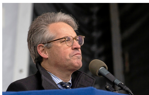
Publizist und Fox-News-Kommentator Eric Metaxas.