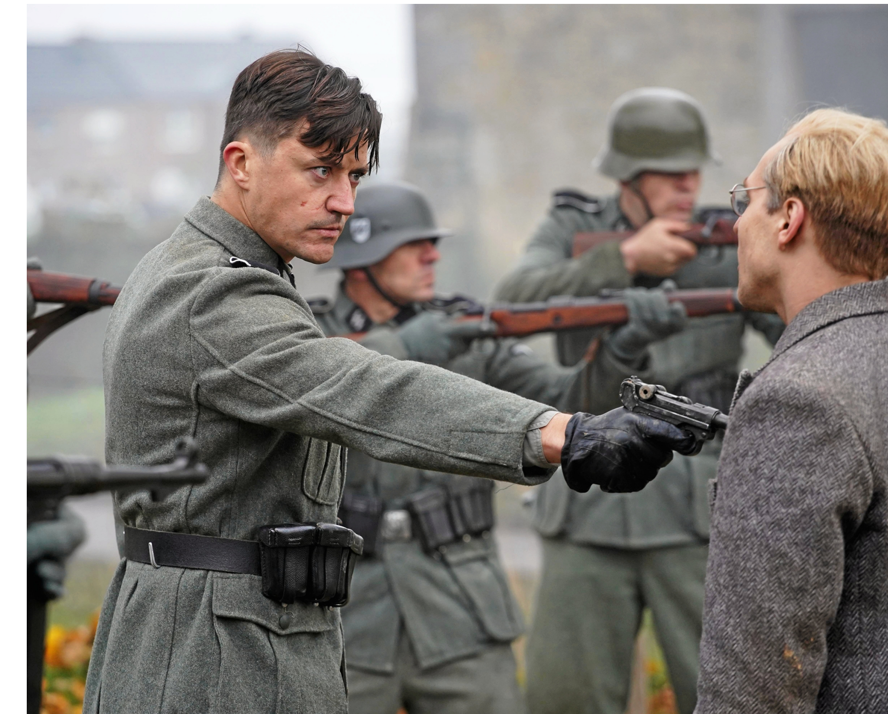
Szene aus dem Film „Bonhoeffer. Pastor. Spy. Assassin“, der von den evangelikalen Angel-Studios produziert wurde.

Wahrscheinlich war es unausweichlich, dass die Popularisierung Bonhoeffers mit seiner Verkitschung einherging. Viele seiner prägnanten Worte fanden sich nun auf Todesanzeigen wieder und schmückten Wohlfühlkalender oder Postkarten mit blühenden Rapsfeldern und Sonnenuntergängen. Der berühmte Satz von dem Rad, dem man in die Speichen fallen müsse, oder von der Überzeugung, die keinen Beifall erwartet, wurden fast geflügelte