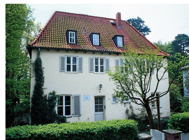
Die Erinnerungs- und Begegnungsstätte Bonhoeffer Haus Berlin an der Marienburger Str. 43 in Charlottenburg.